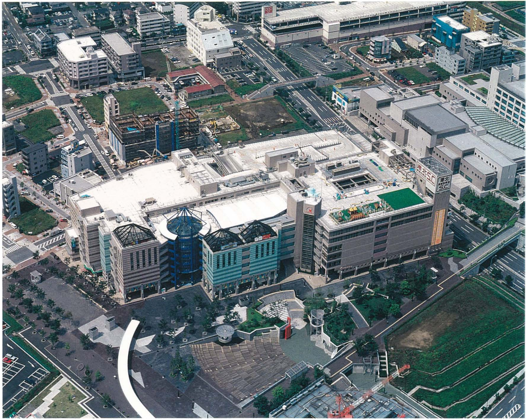
平成 1 0 年 4 月 撮 影