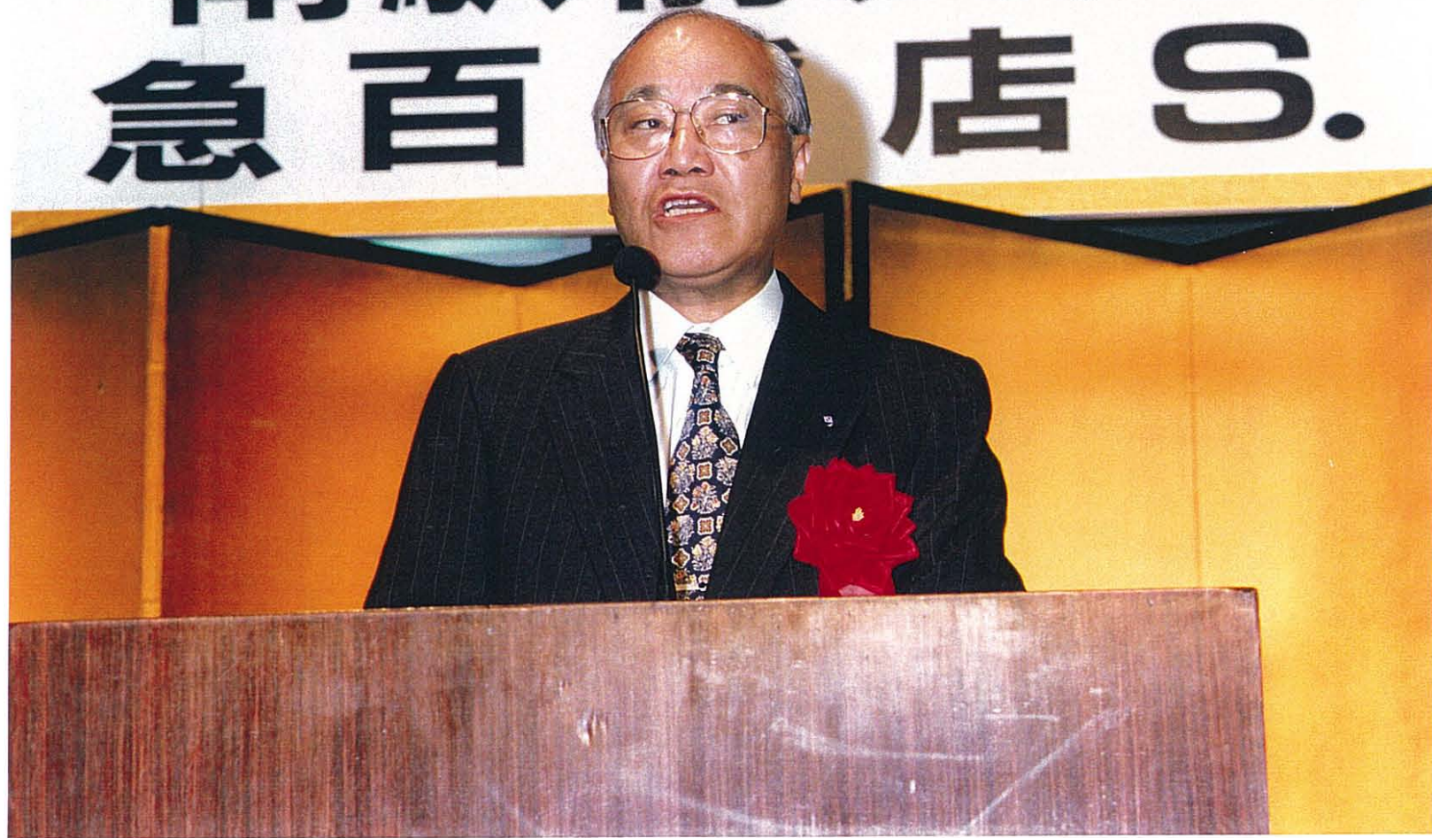
高秀秀信 横浜市長