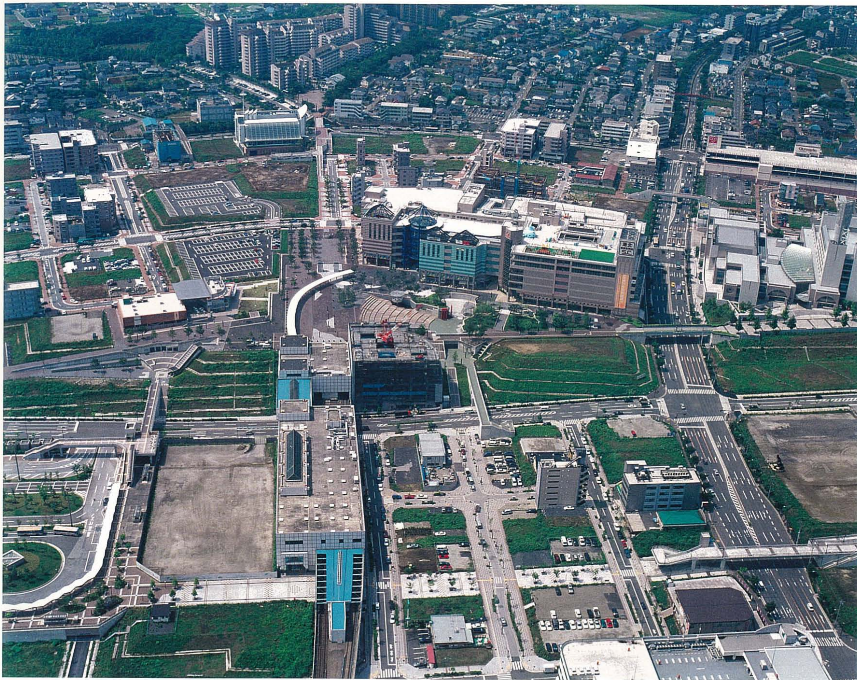
平成 1 0 年 4 月 撮 影