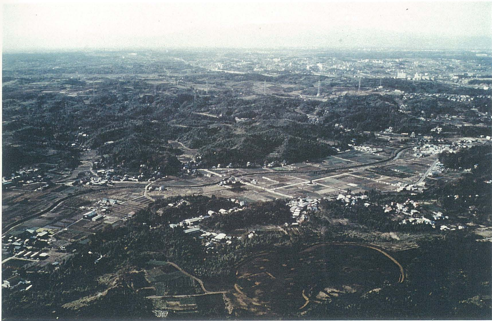
昭和50年撮影 大塚遺跡上空よりタウンセンター第二地区方向を望む